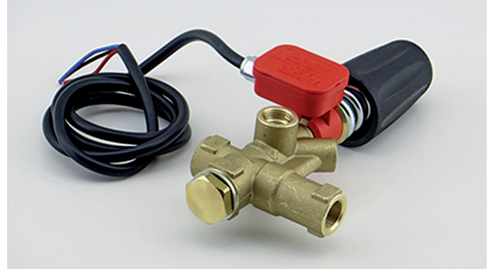
Unloader-Ventil KD 4x4 Art.-Nr. 352606