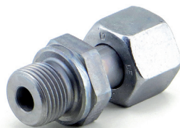
Verschraubung M18x1,5 3/8" (Art.-Nr. 2359)