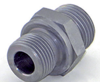
Nippels M18x1,5 3/8" (Art.-Nr. 2157)